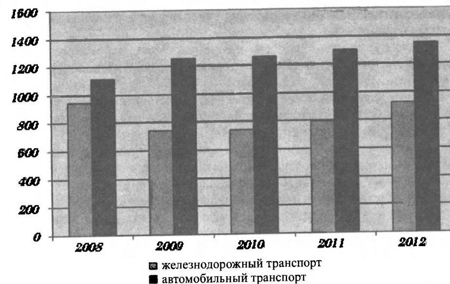
Рис. 2. Грузооборот сухопутных видов транспорта (млн. ткм)

обеспечивающей до 70 % прибытия и половину отправления грузов. Доставка грузов по линии Луговая – Балыкчи осуществляется: