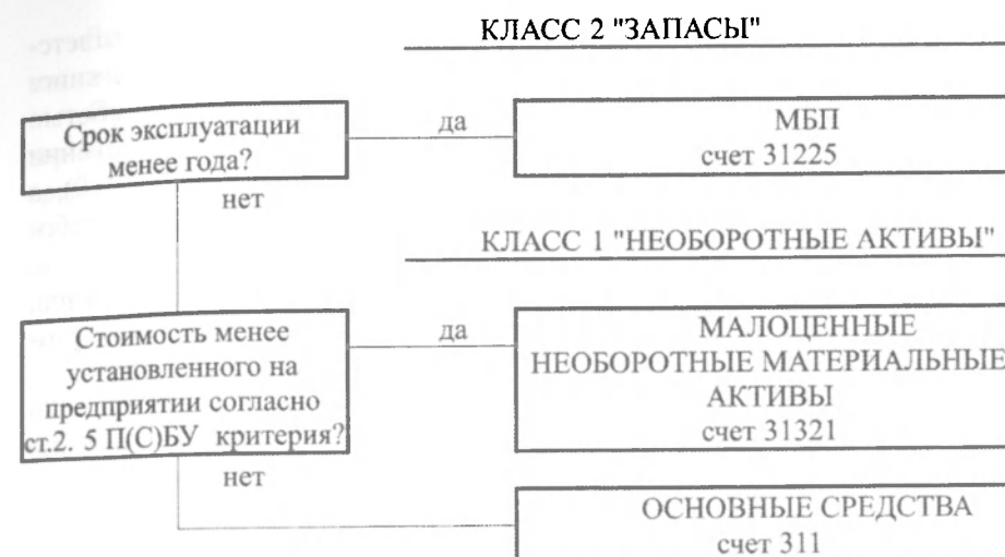
Схема 1. Классировка материальных активов.

Учет и оценка малоценных и быстроизнашивающихся предметов в бюджетных учреждениях науки